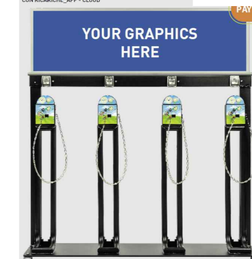
Colonnina ricarica e-bike a quattro postazioni

VERSIONE PAY Pagamento disponibile: CON RICARICHE_APP - CLOUD