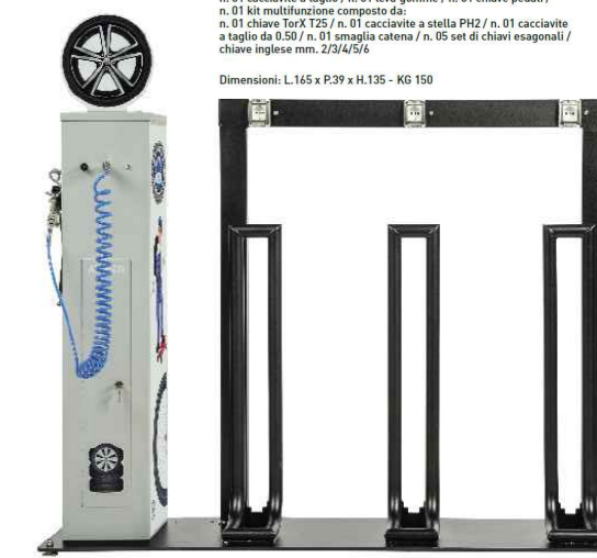
Colonnina ricarica e-bike a tre postazioni con service

Dimensioni: L.165 x P.39 x H.135 - KG 150